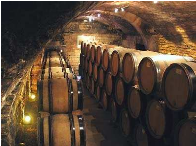
Een ondergrondse kelder van de 14 de eeuw

Domaine Goisot is een familiaal bedrijf, waarvan de geschiedenis teruggaat tot in de 14 de eeuw. De wijngaarden in dit gebied dateren al van de 2 de eeuw en bereikten hun grootste productie-gebied in de jaren 1850 met bijna 40.000 hectare wijngaarden, waardoor het de grootste wijngaard van Frankrijk was. Deze werden echter verwoest door de phylloxera. Vandaag zijn er terug meer dan 6.000 hectaren